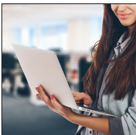
Våra kunniga föreläsare berättar hur SBA på bästa sätt kan dokumenteras.