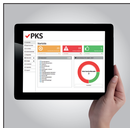
Vi visar verktyget PKS som hjälper er hålla reda på allt relaterat till det systematiska brandskyddet.

>>> Gå in på www.presto.se/frukost/ för att anmäl dig och dina kollegor!